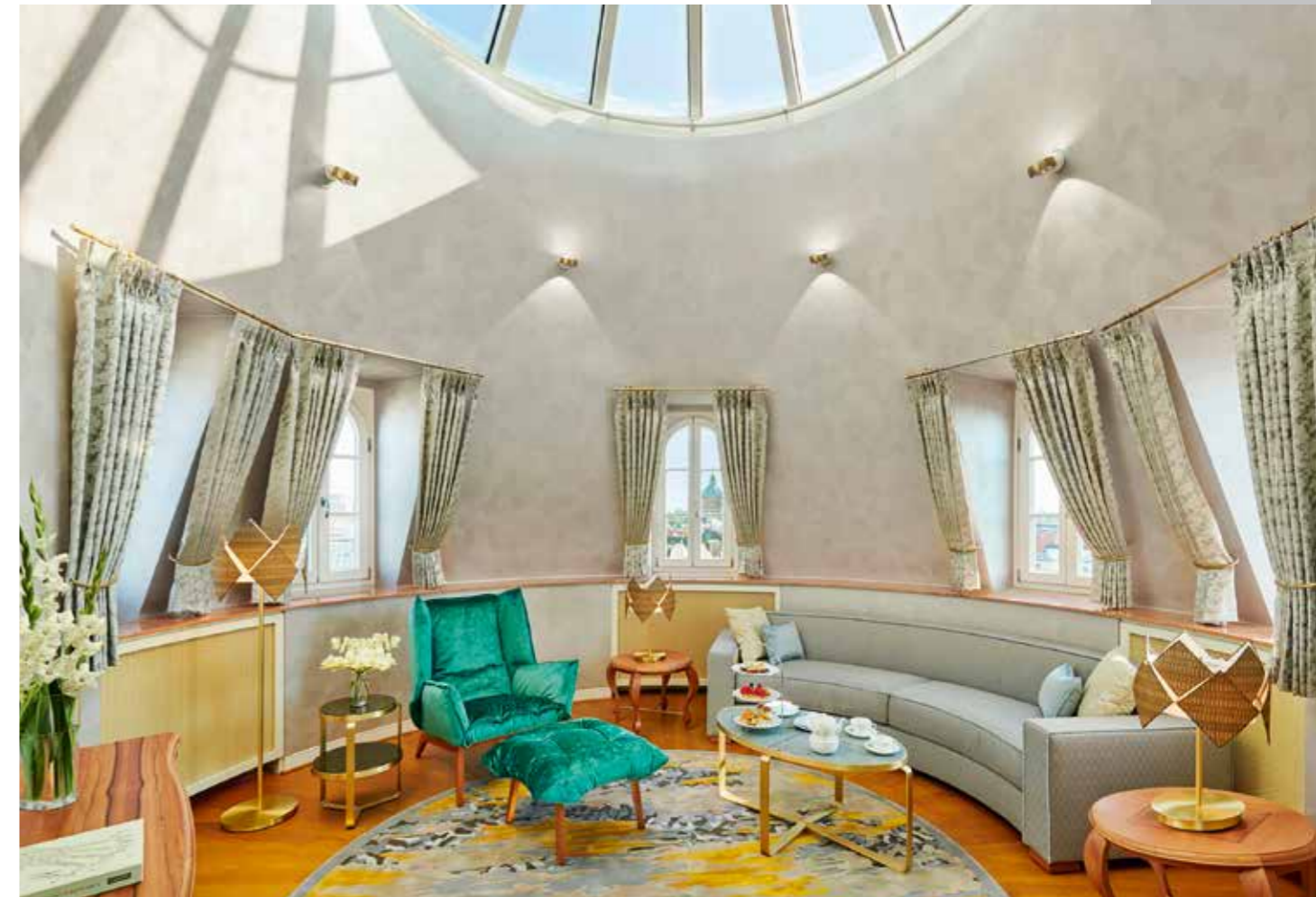
Bayerische Grandezza wie im Märchen aus 1000 und einer Nacht – erlesener Chic vereint mit modernster Technik und klassischem Komfort in den strahlend neuen Zimmern und Suiten des Mandarin Oriental München.