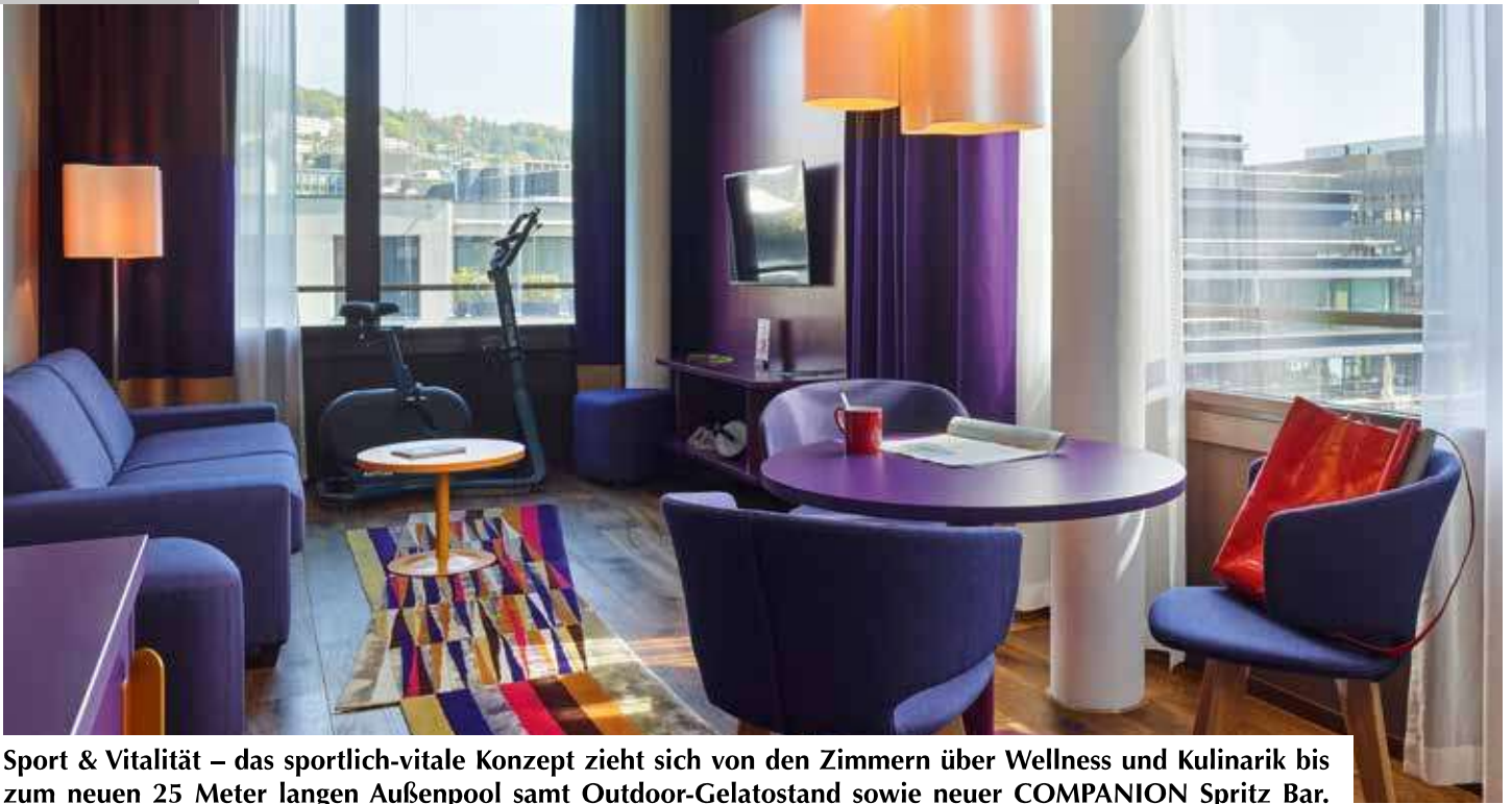
Sport & Vitalität – das sportlich-vitale Konzept zieht sich von den Zimmern über Wellness und Kulinarik bis zum neuen 25 Meter langen Außenpool samt Outdoor-Gelatostand sowie neuer COMPANION Spritz Bar.