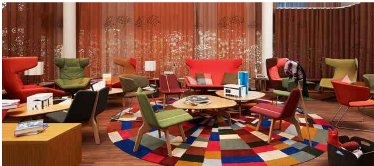
Unverwechselbar im neuen sportlich-eleganten Design präsentieren sich Wohnzimmer & Lobby im 25hours Hotel Zürich West.

Wie gewohnt einzigartig, so präsentiert sich jetzt auch das sportliche 25hours Hotel Zürich West.